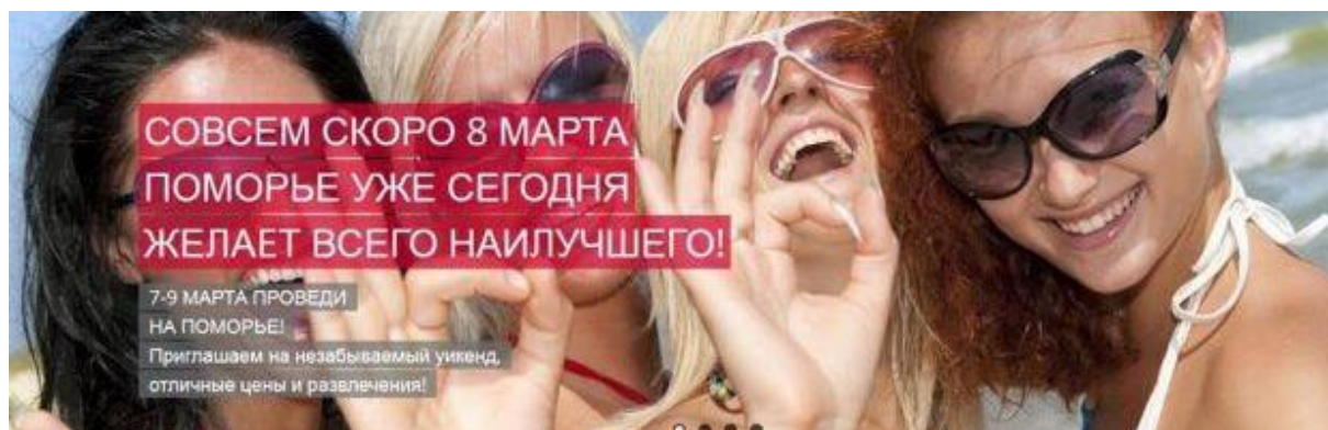
W ten sposób reklamowano akcję w obwodzie królewieckim.

„(...) na gości z Rosji czekały atrakcyjne promocje, zniżki, pakiety pobytowe, wieczory tematyczne. Specjalną ofertę zakupową przygotowało także gdyńskie centrum handlowe Riviera, które zapewniło bezpłatny transport autokarami do Trójmiasta. Pobyt w Polsce stał się niezapomniany od pierwszych chwil. W sobotę na granicy przyjezdnych czekała niespodzianka. Na przejściach w Gronowie i Grzechotkach panie otrzymały miły i symbolizujący stolicę Pomorza prezent... niespodziankę. To