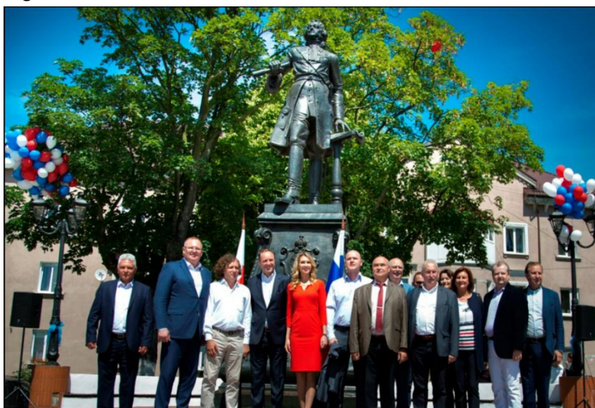
Spotkanie pod pomnikiem Piotra Wielkiego w Bałtyjsku.

Organizowanie regat zawieszono w 2019 roku.